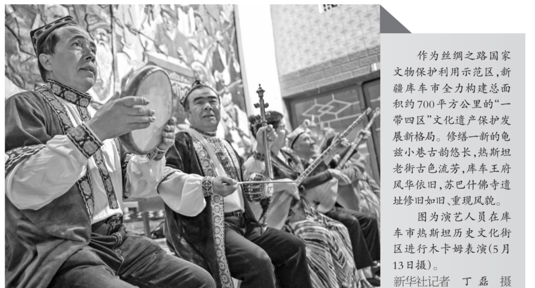
作为丝绸之路国家文物保护单位示范区，新疆库车市全力构建总面积约700平方公里的“一带四区”文化遗产保护发展新格局。修缮一新的龟兹小巷古韵悠长，热斯坦老街古色流芳，库车王府风华依旧，苏巴什佛寺遗址修旧如旧、重现风貌。

作为本次活动的核心内容，红色文创产品展示聚焦“思想性、艺术性、实用性”相统一，汇聚全国63家博物馆、纪念馆的724款优秀原创红色文创产品。展品涵盖纪念徽章、文具饰品、生活潮物等品类，生动展现了新时代红色文创产品守正创新的鲜活实践。活动采取“展示+销售”相结合的方式，部分精选产品还在首届中国新文创市集暨潮玩游园会主会场同步展销，不断扩大红色文化传播覆盖面与影响力。