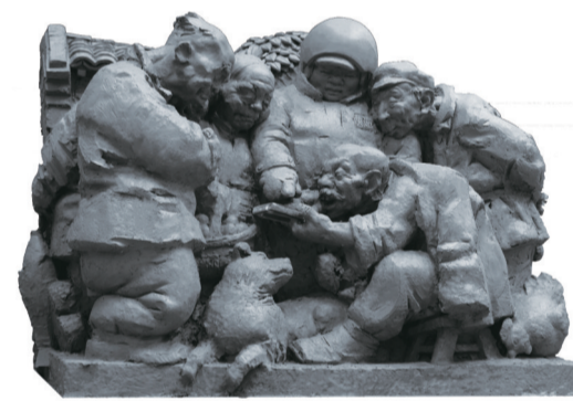
下单(雕塑) 120×70×90厘米 张哲宇