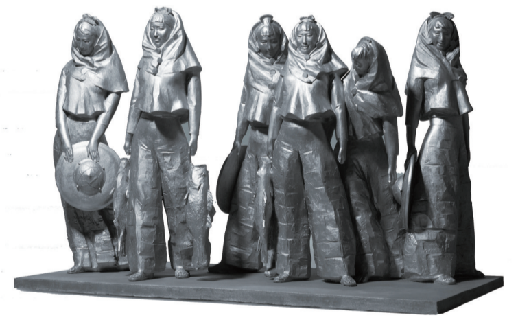
海丝起点的美好生活(雕塑) 160×80×95厘米 李继成