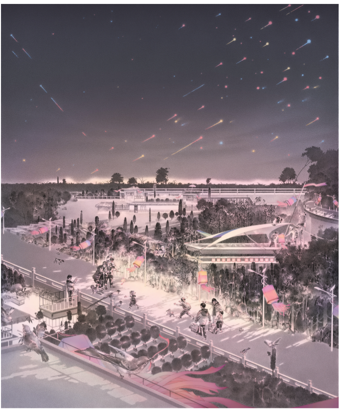
月是故乡明(版画) 119×100厘米 张昊