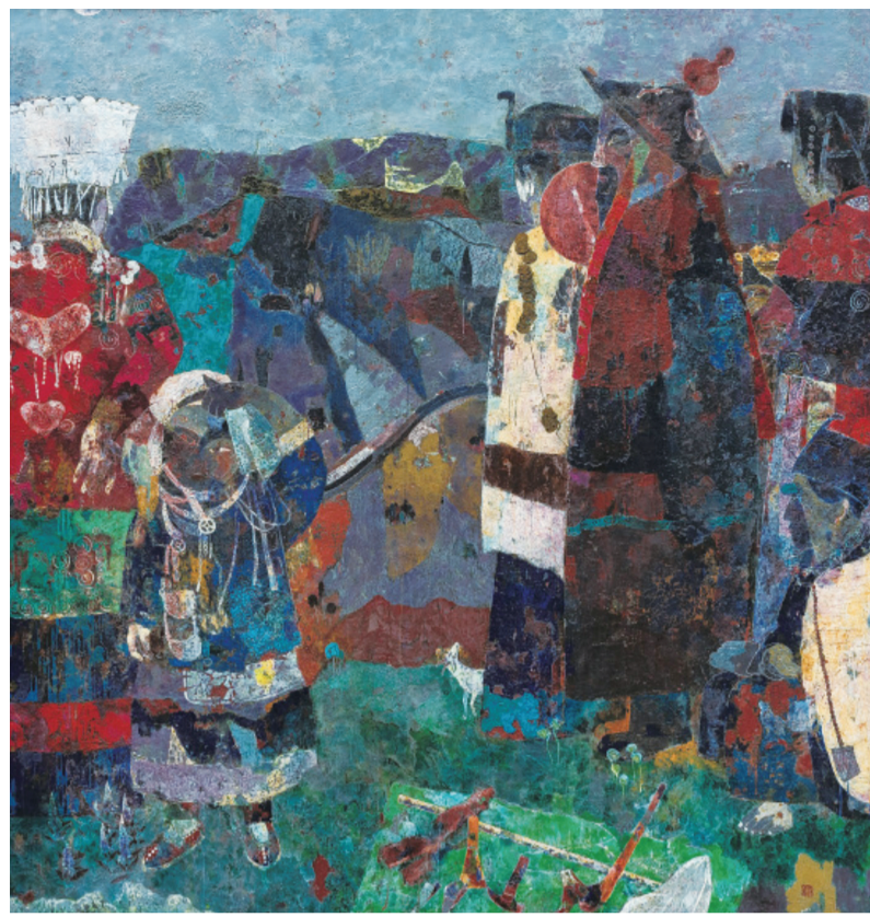
古韵弄风(油画) 200×190厘米 魏义