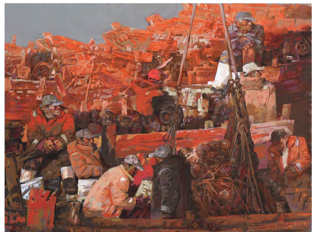
金石滩(水彩) 120×160厘米 晏大霖