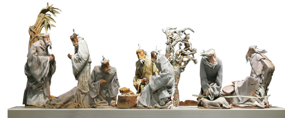
竹林七贤(雕塑) 180×66×60厘米 杨淑馨