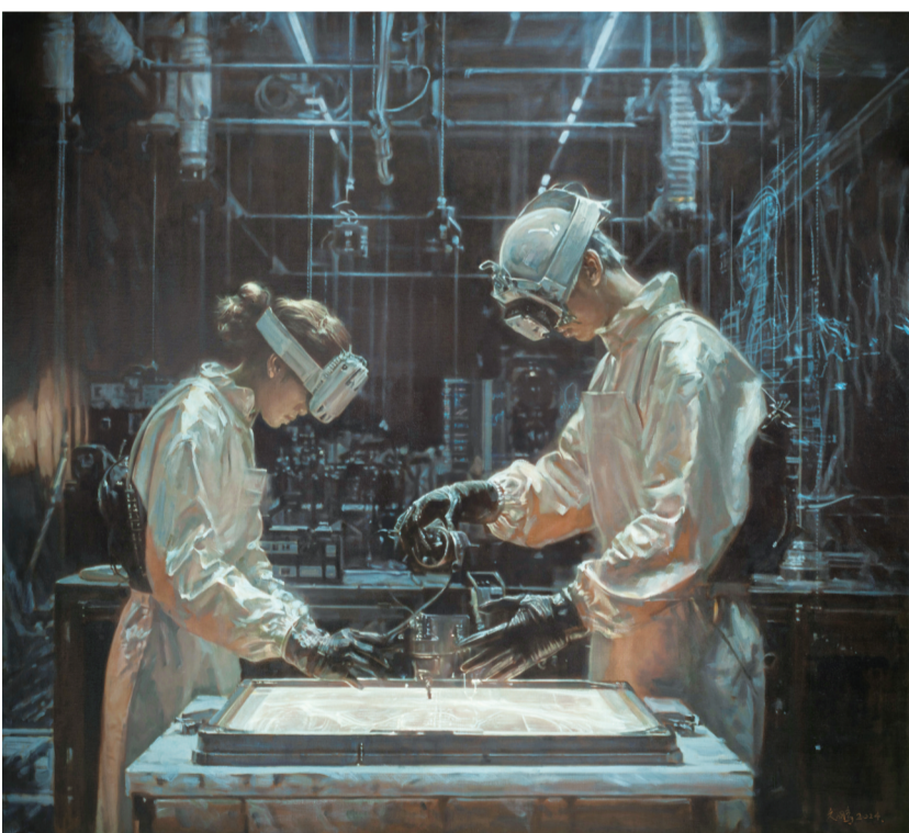
抛光者(油画) 175×195厘米 范久鹏