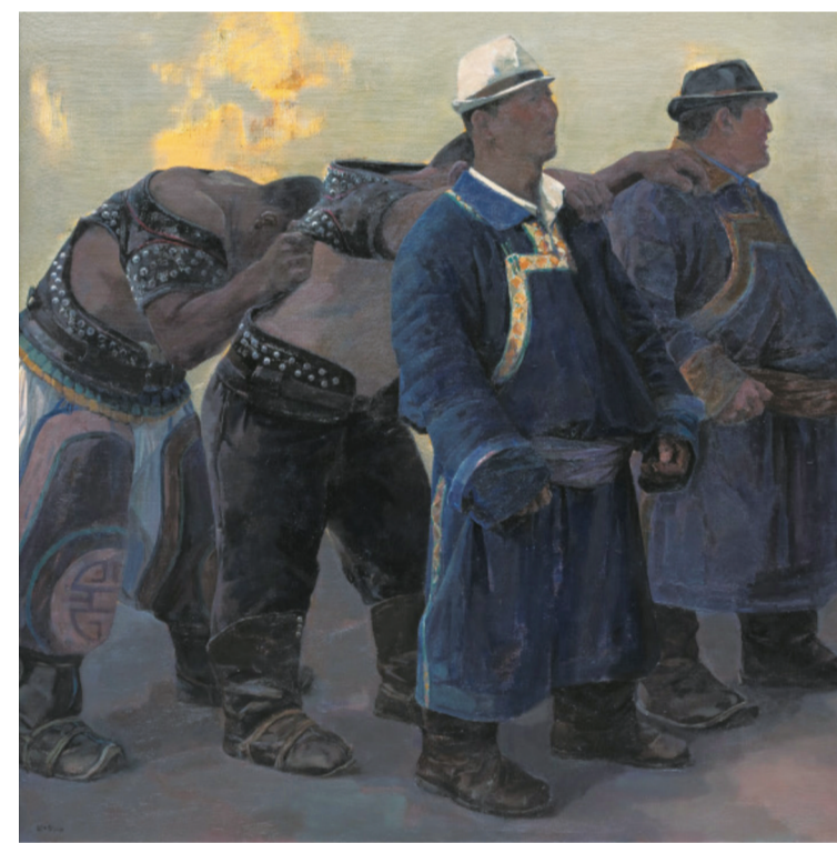
蒙古族博克文化(油画) 150×150厘米 朝日委