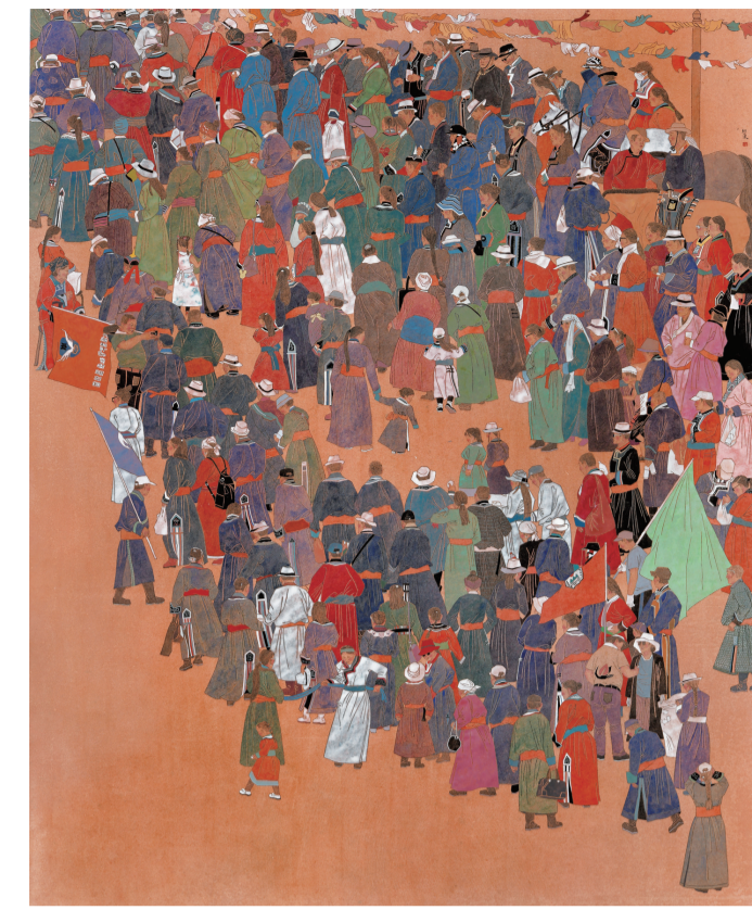
盛装(国画) 228×184厘米 郭洪渠