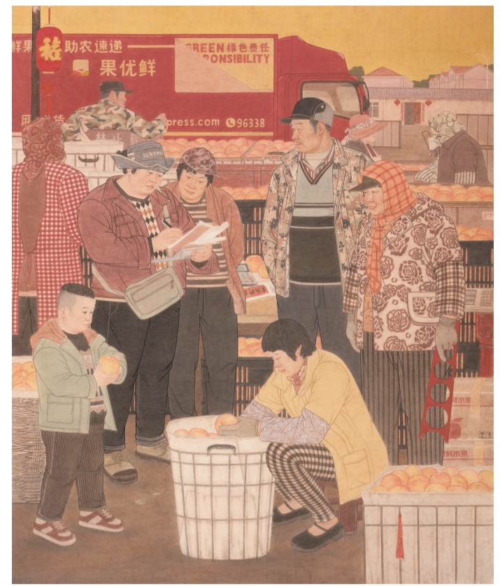
秋风岁捻菜飘香(国画) 240×200厘米 徐正欣