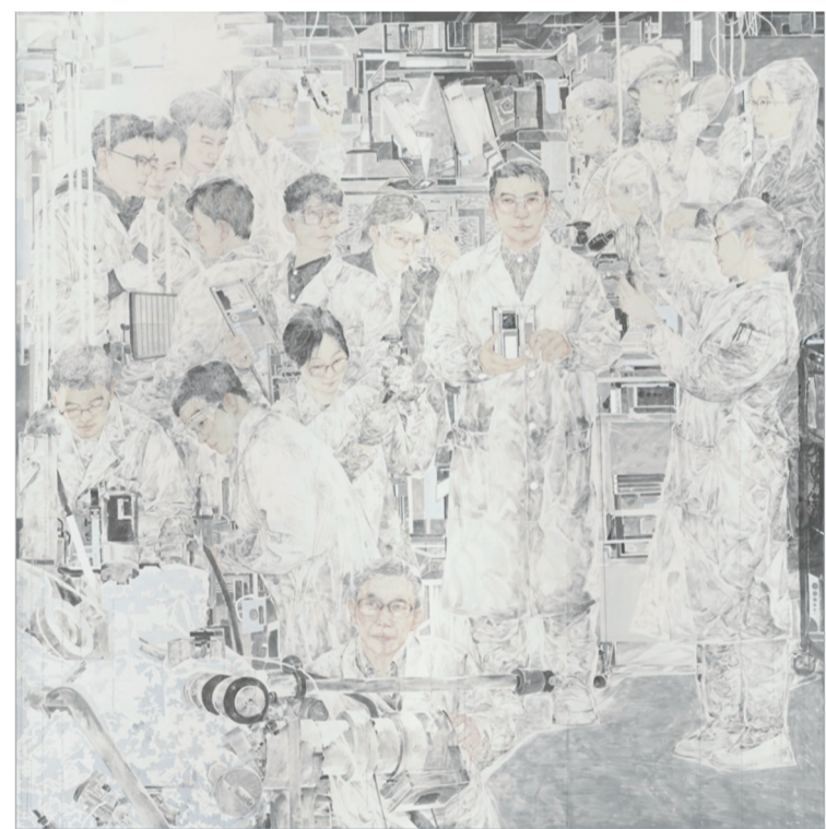
中国芯(国画) 234×232厘米 孟祥军