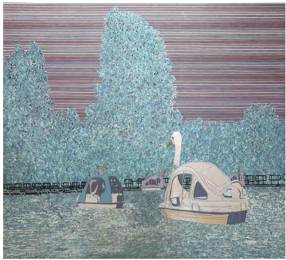
恬静美好的生活(漆画) 176×196厘米 林涛