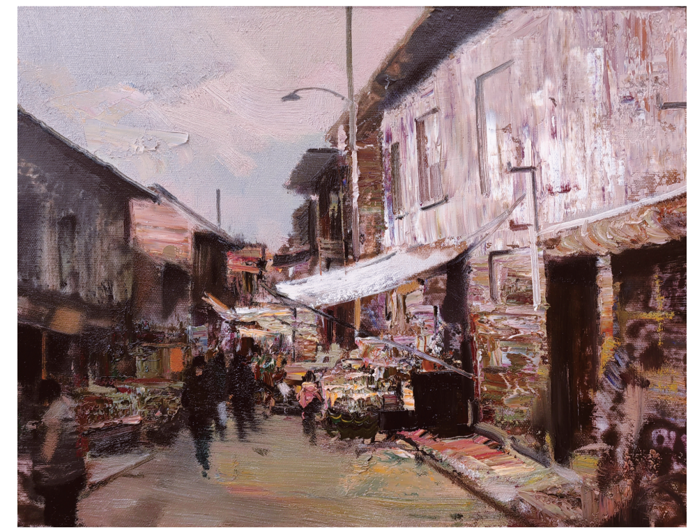
云州神韵(油画) 50×60厘米 杨晓文