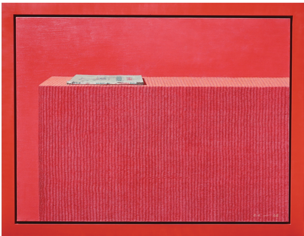
百年筑梦(油画) 140×180厘米 黄鸣