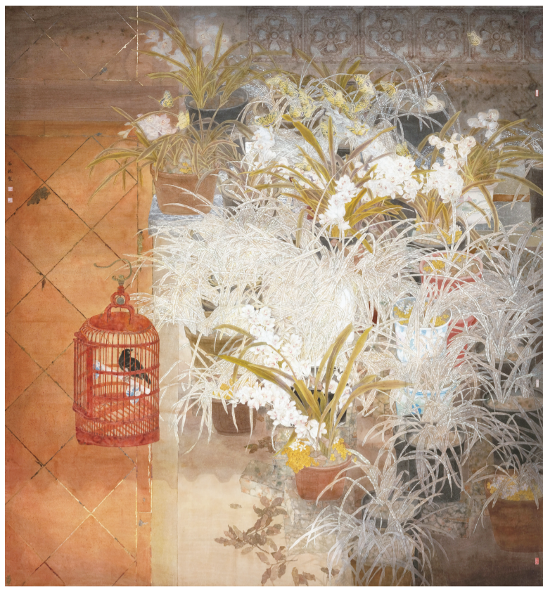
秋庭野意恬悠游(国画) 236×220厘米 邓海林