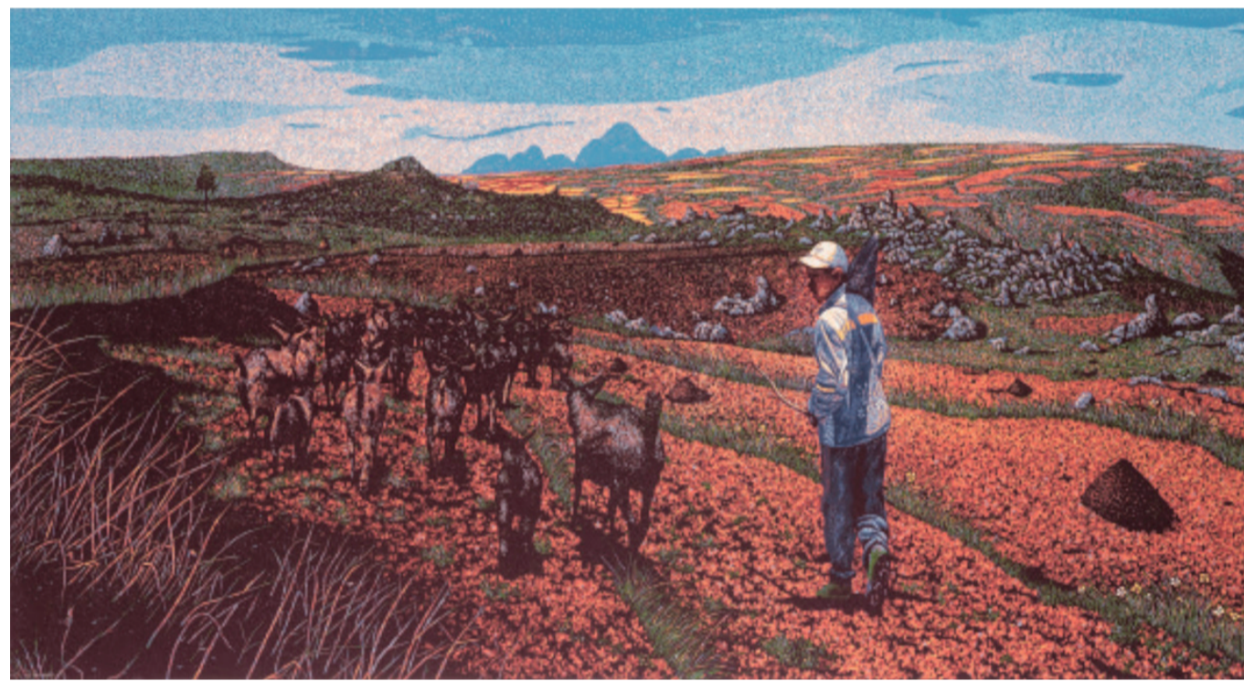
云贵高原(版画) 65×122厘米 吴新林