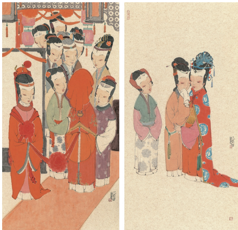
红楼梦组画局部(国画) 136×68厘米×3 李德惠