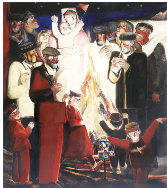
高原之夜(水彩) 197×173厘米 鲍军涛