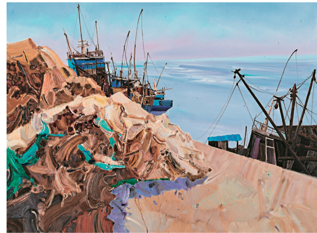
正午的渔浴(油画) 100×120厘米 祁百成