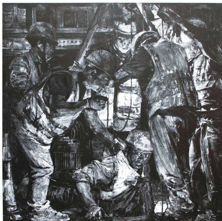
路边作业的管道工们(版画) 166×166厘米 曹丹