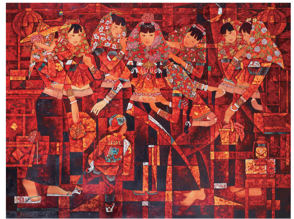
喜事红妆(漆画) 120×160厘米 苏国伟