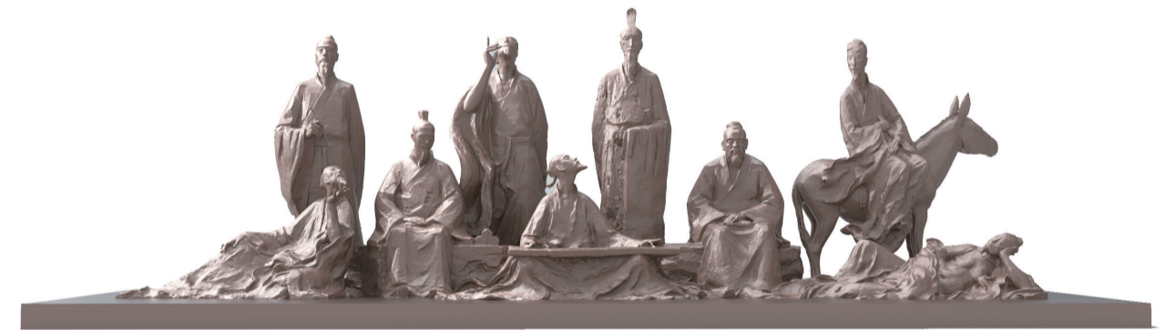
传承(雕塑) 120×50×40厘米 袁磊