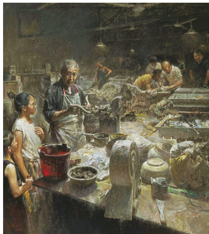
匠心(油画) 200×180厘米 袁可