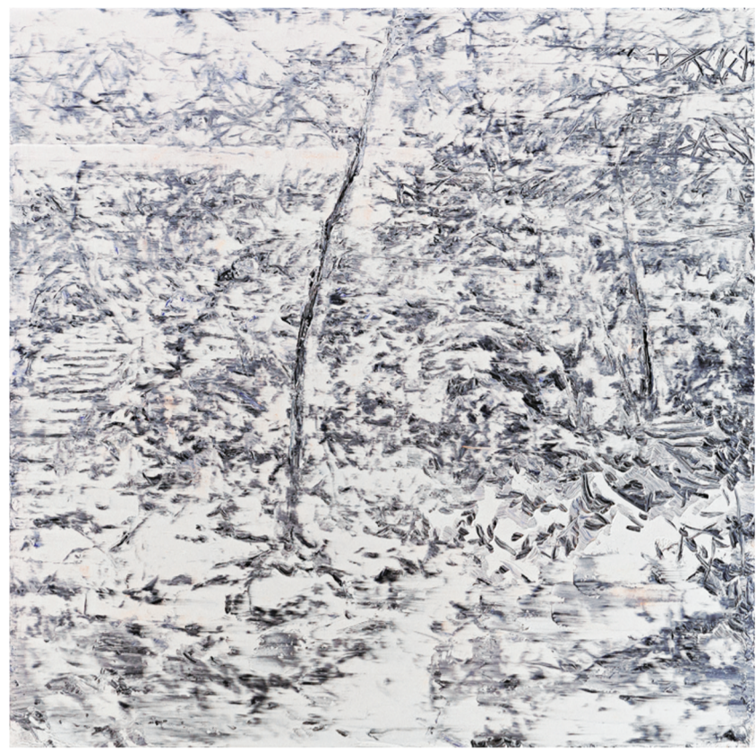
光影·山水(油画) 100×100厘米 余旭红