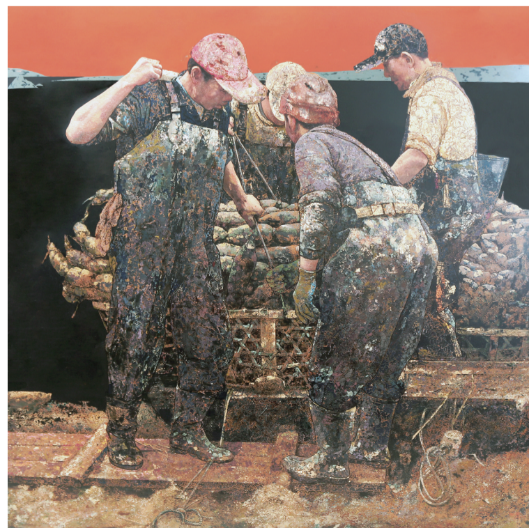
牧岸藕丰(漆画) 180×180厘米 何志辉