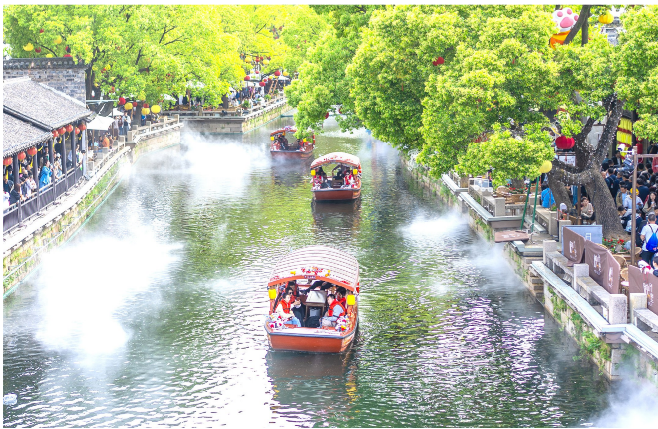
2026年5月3日,游客在江苏省无锡市惠山映月街街区游玩(无人机照片)。