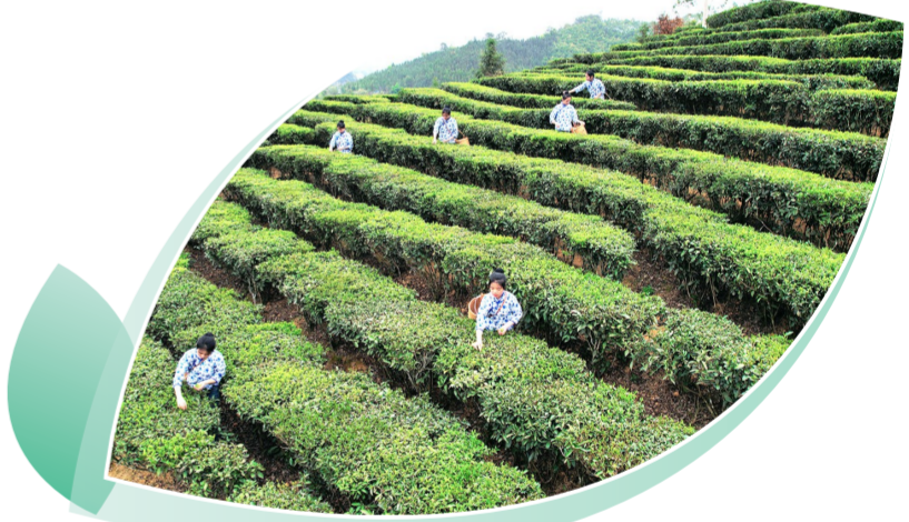
在梧州市苍梧县六堡镇,茶娘在茶园采摘茶叶。

业集聚发展,引进了张一元、中肯茶业、农夫山泉等龙头企业,全市有茉莉花茶(茶)产业规模以上企业69家,规模以上工业产值约64亿元。