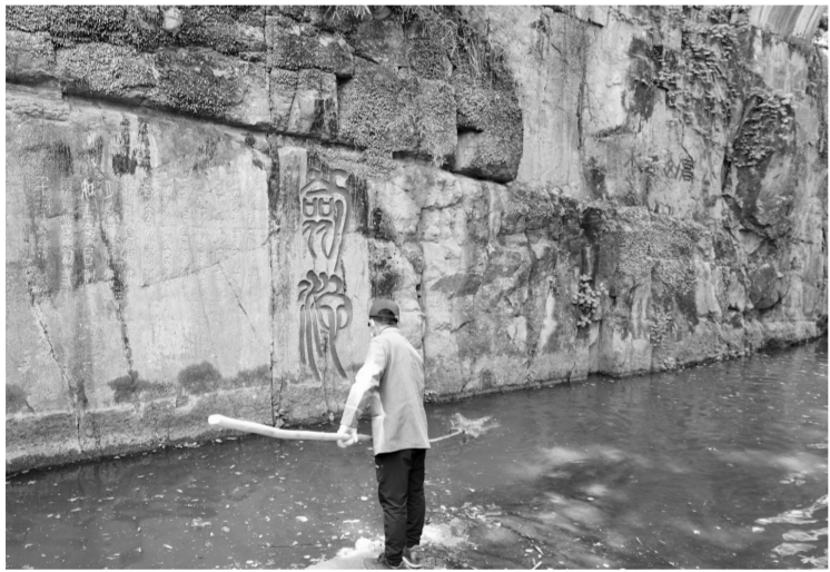
江苏苏州虎丘山风景区的工作人员正在清理水池。