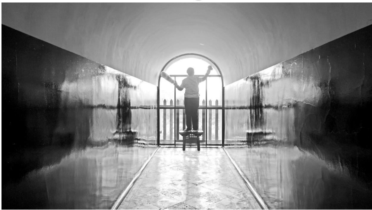
陕西西安大雁塔的保洁人员正在打扫门窗。