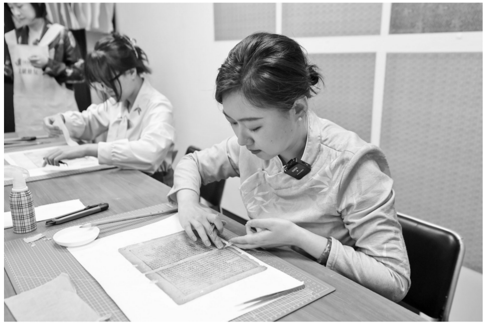
一名青年馆员正在用自己的专业知识修复古籍。