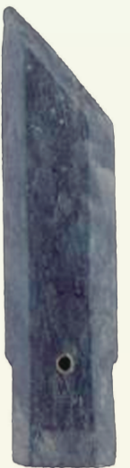
山西考古博物馆藏

玉璋出土于山西省翼城县大河口霸国墓地。整体偏长条形,顶端斜刃呈尖首,符合文献中“半圭为璋”的说法。器身两侧边缘磨薄成刃,底端斜直,柄部有钻圆穿,素面无纹属于西周时期。值得注意的是,西周时期霸国属于三等伯爵诸侯国,玉璋纹饰较周原地区简朴,尺寸普遍小于同期晋侯墓地出土品,这种差异折射出诸侯国在周礼框架内的等级区隔。作为古代重要礼器,玉璋与立夏“迎夏”祭礼相呼应,体现古人顺天应时的信仰。